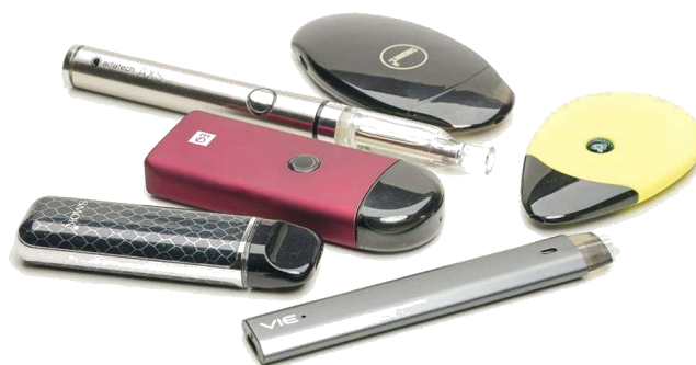
Rajah 2: Produk merokok alaf baharu termasuk rokok elektronik / vape

Rokok elektronik merupakan peranti yang digunakan untuk memanaskan bahan hasilan tembakau atau cecair yang mengandungi nikotin ataupun bahan-bahan lain selain produk tembakau yang disedut dan dihembus untuk tujuan merokok. Rokok elektronik merupakan satu kaedah baharu yang telah dicipta bagi menggantikan rokok konvensional. Penciptaan rokok elektronik telah mula berkembang seawal tahun 2000. Di Malaysia, penggunaan rokok elektronik telah bermula seawal tahun 2013 dan memuncak pada tahun 2016.