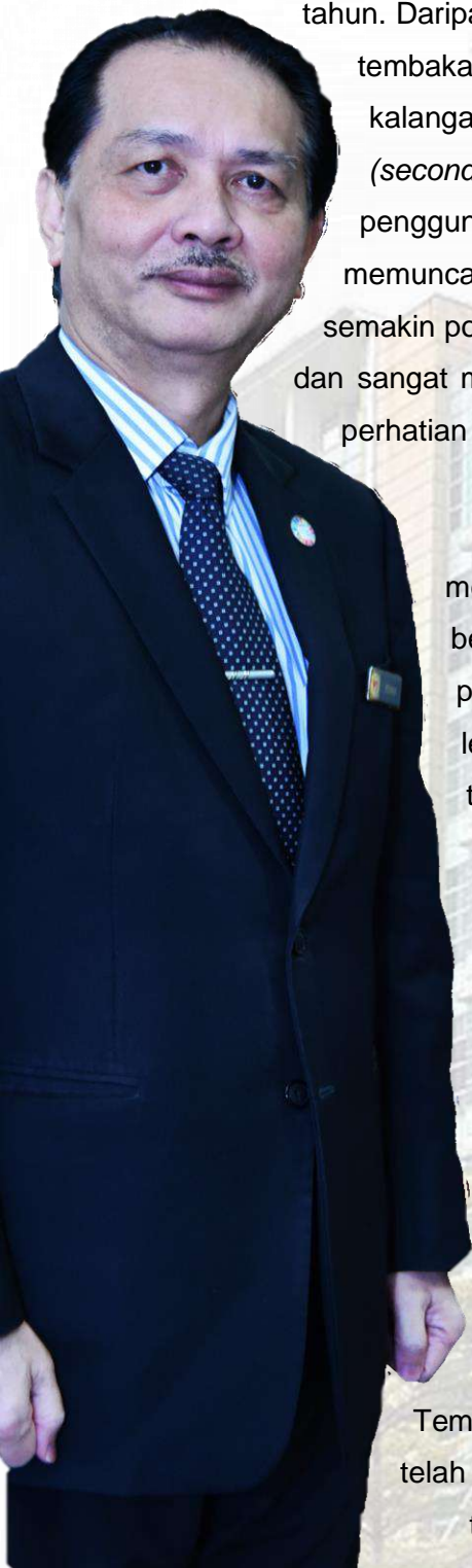
YBHG. TAN SRI DATO' SERI DR. NOOR HISHAM BIN ABDULLAH

Pertama, pemerksaan masyarakat dan penglibatan multisektoral. Kedua, penguatkuasaan perundangan dan