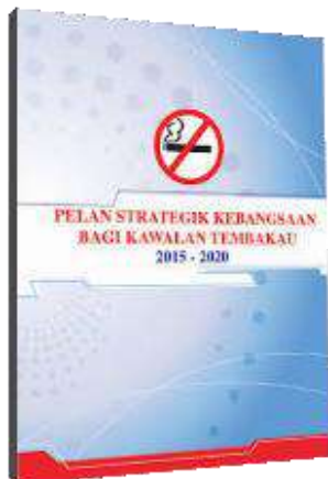
Rajah 1: Pelan Strategik Kebangsaan bagi Kawalan Tembakau 2015-2020

Pelan Strategik Kebangsaan Bagi Kawalan Tembakau 2015-2020 merupakan pelan strategik pertama di Malaysia sejak negara menjadi anggota kepada World Health Organization Framework Convention on Tobacco Control (WHO FCTC) . Pelan ini bukan sahaja menjadi rujukan kepada pihak kerajaan tetapi kepada badan bukan kerajaan dan agensi lain yang turut terlibat dalam aktiviti pengukuhan kawalan merokok dan produk tembakau di Malaysia. Pelan ini juga dirangka secara bersasar mengikut Strategi MPOWER yang digariskan oleh WHO FCTC sejak tahun 2005.